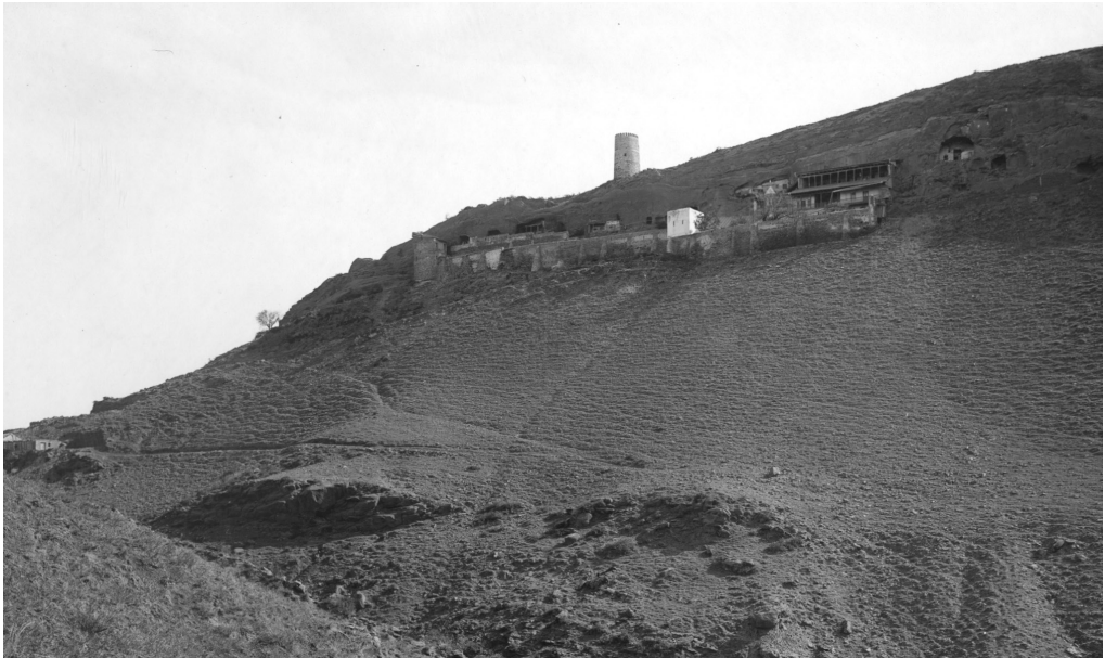
სურ. 3. წმ. იოანე ნათლისმცემლის მონასტრის საერთო ხედი სამხრეთ-აღმოსავლეთიდან, 1913 წ.