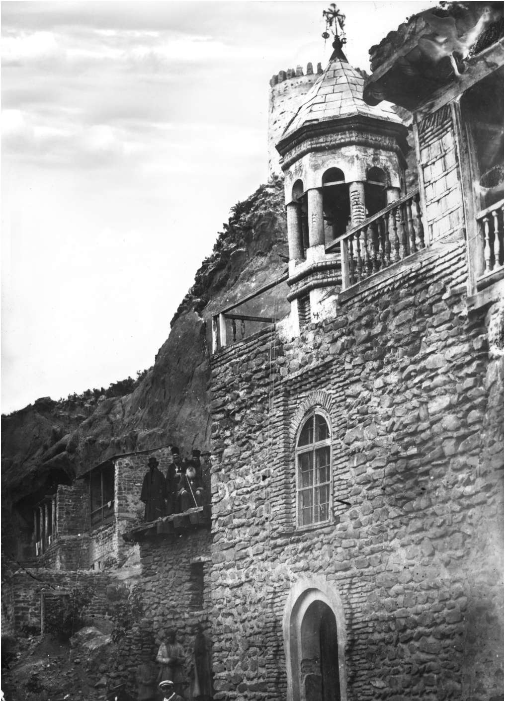
სურ. 4. წმ. იოანე ნათლისმცემლის მონასტრის სამრეკლო. 1880-იანი წლები