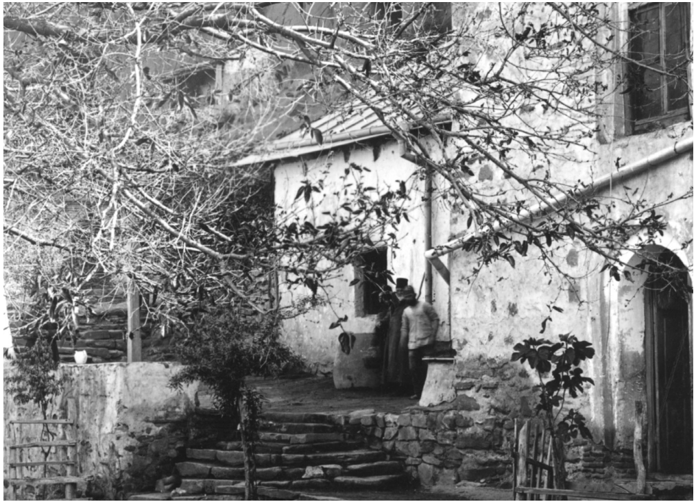
სურ. 6. წმ. იოანე ნათლისმცემლის მონასტრის ეზოს ცენტრალური ნაწილი, ხედი აღმოსავლეთიდან, 1913 წ. დეტალი

ამ მგზავრობის დროს მას აღუწერია მონასტრის სამლოცველოები, მოხატულობები, აღუწუსხავს ლაპიდარული და ფრესკული წარწერების ნაწილი, იმჟამად იქ დაცული საეკლესიო სინმინდებები მათზე არსებული წარწერებით. ჩანაწერებს ერთვის მრავალმთის წმ. იოანე ნათლისმცემლის მონასტრის წინამძღვართა ნუსხა 1639 წლიდან 1840-იან წლებამდე (სურ. 2).