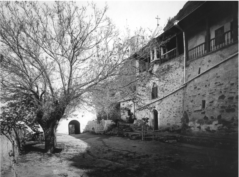
სურ. 5. წმ. იოანე ნათლისმცემლის მონასტრის ეზოს ცენტრალური ნაწილი, ხედი აღმოსავლეთიდან 1913 წ.

საქმე N48 (უბის წიგნაკები სხვადასხვა ხასიათის ისტორიული ჩანაწერებით, ქართულ და რუსულ ენებზე, ავტოგრაფი, უთარილო) — შესულია წარწერების (მათ შორის — ეპიტაფიების) გადმონაწერები, მოხატულობათა აღწერები, ჩანახატები, აგრეთვე საარქივო (უმთავრესად საქართველო-იმერეთის სინოდის კანტორის) დოკუმენტებიდან ამონერილი ინფორმაცია გარეჯის სამონასტრო ცხოვრების შესახებ (სურ. 1). ამ მასალის უმეტესი ნაწილი უთარილოა, თუმცა ერთსა და იმავე პერიოდში ჩანერილი მასალების გარჩევა მაინც შესაძლებელია. აღსანიშნავია, რომ ისინი ერთმანეთს თანმიმდევრულად არ მიჰყვება — მოთავსებულია სხვადასხვა ფურცელზე, რომელთა შორის ჩართულია სხვა მასალებიც.