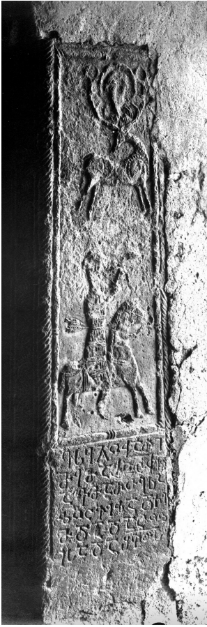
სურ. 7. წმ. იოანე ნათლისმცემლის მონასტერი. სტელა წმ. ევსტათე პლაკიდას ნადირობის გამოსახულებით

სწევოდა მაშინ, როცა იგი მარტყოფის მაცხოვრის ხელთუქმნელი ხატის ეკლესი- ის წინამძღვარი იყო, სახელდობრ, 1908- 1918 წლებში.