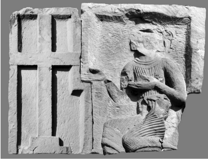
სურ. 4 საქტიტორო კომპოზიციის სავარაუდო რეკონსტრუქცია