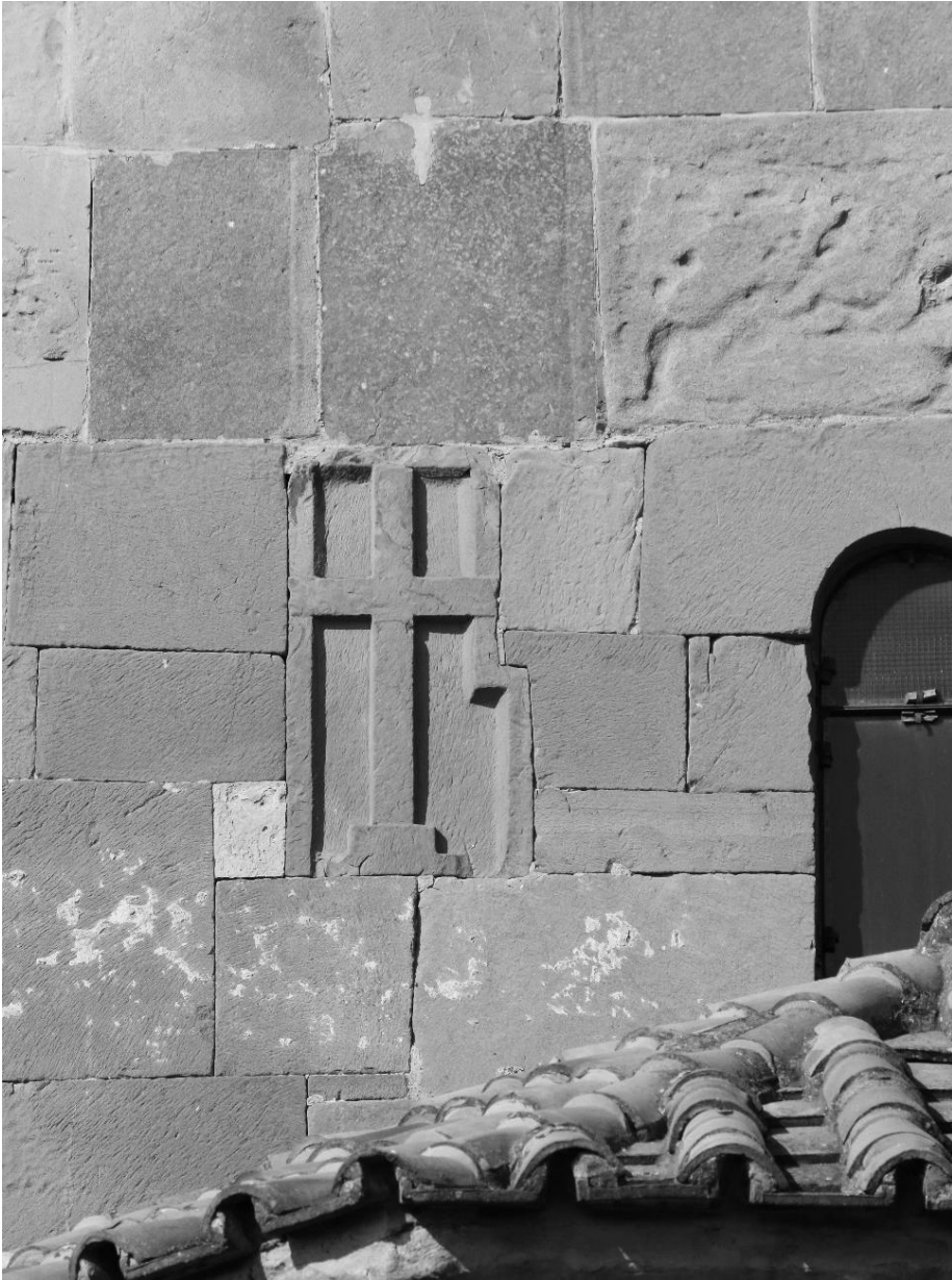
სურ. 3 რელიეფი გოლგოთის ჯვრის გამოსახულებით მცხეთის წმ. ჯვრის ეკლესიის გუმბათის აღმოსავლეთ ნახნაგზე