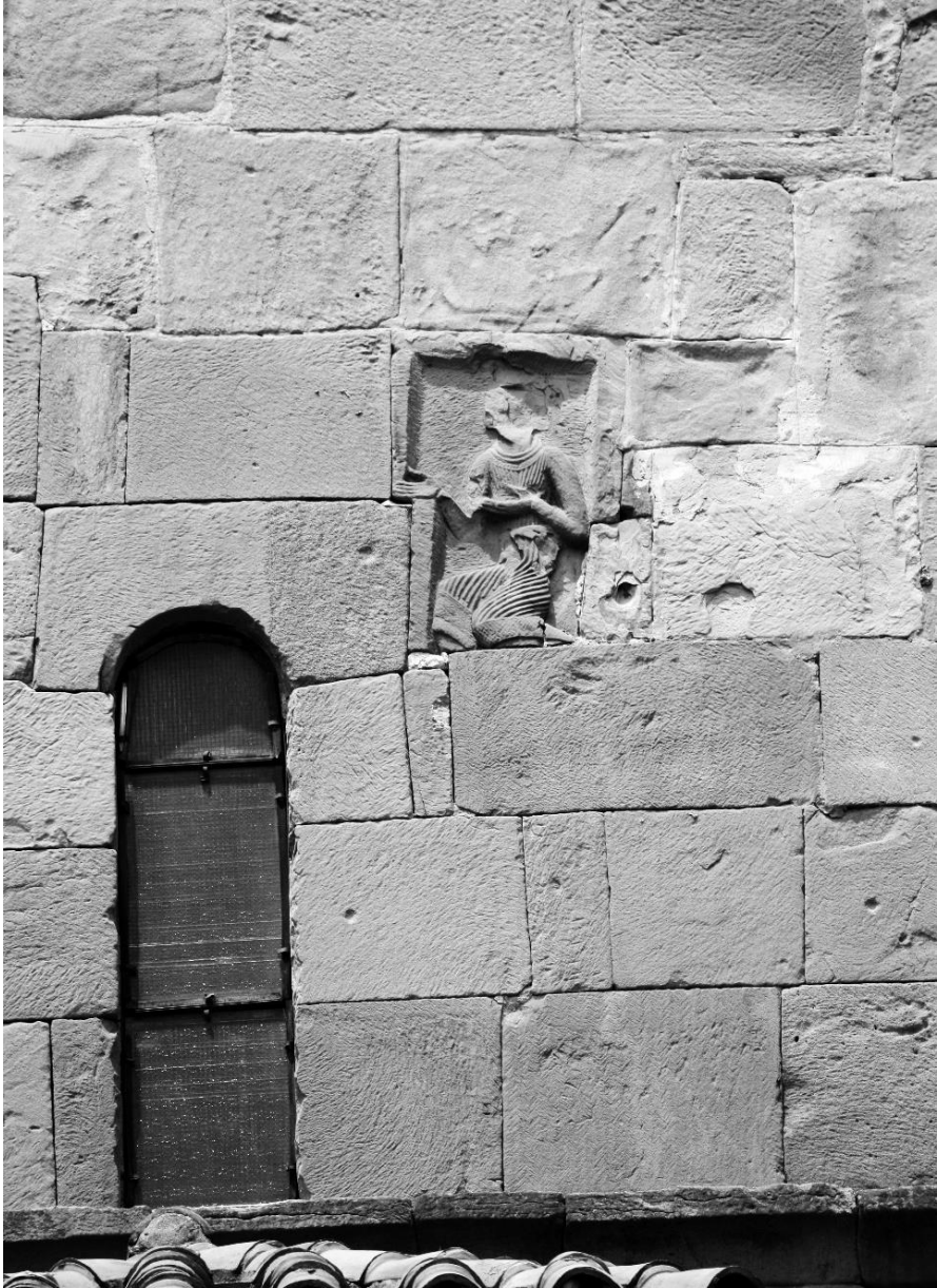
სურ. 2 რელიეფი მუხლმოყრილი მავედრებელი მამაკაცის გამოსახულებით მცხეთის წმ. ჯვრის ეკლესიის გუმბათის სამხრეთ ნახნაგზე