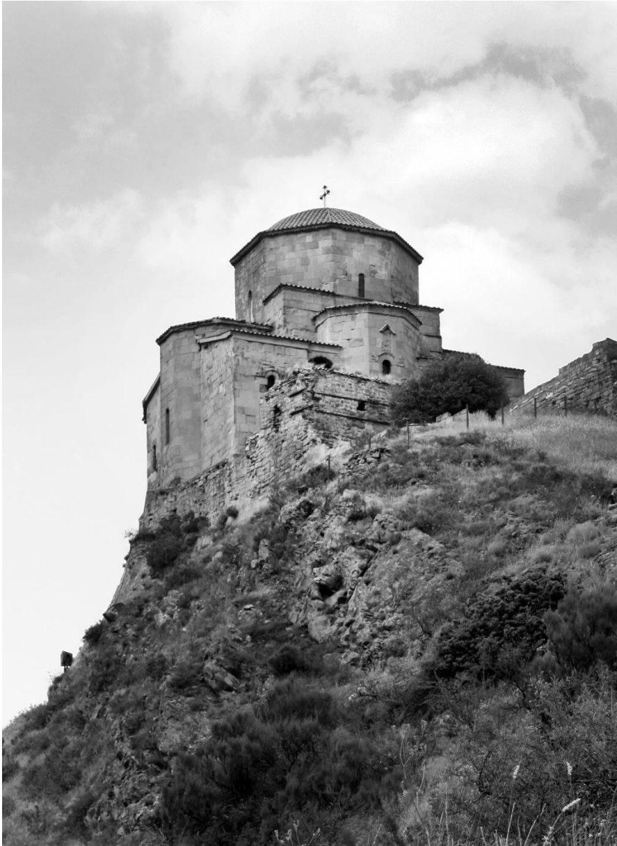
სურ. 1 მცხეთის წმ. ჯვრის ეკლესია. ხედი სამხრეთ-დასავლეთიდან